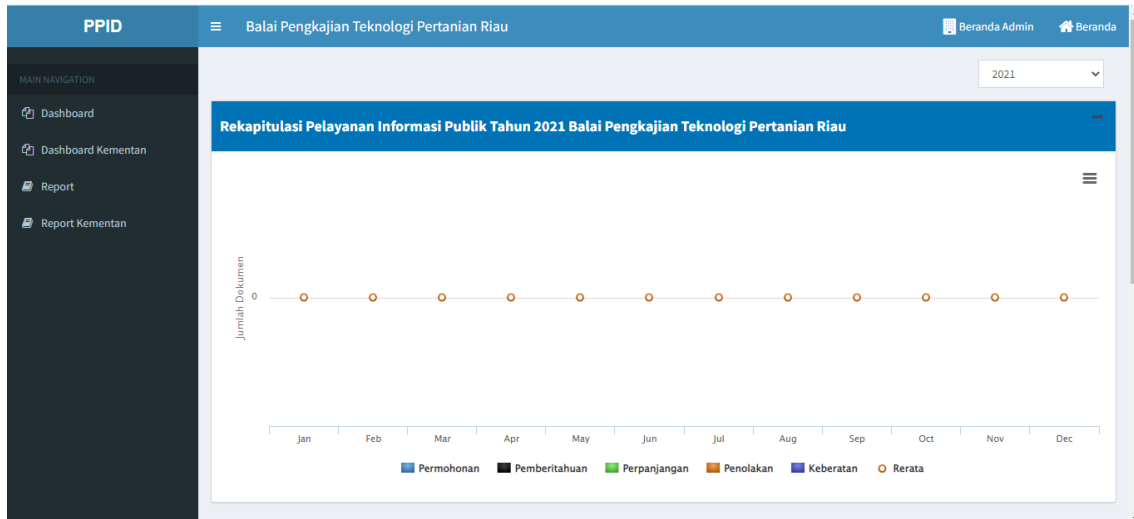
Gambar 2. Rekapitulasi Pelayanan Publik 2021 BPTP Riau